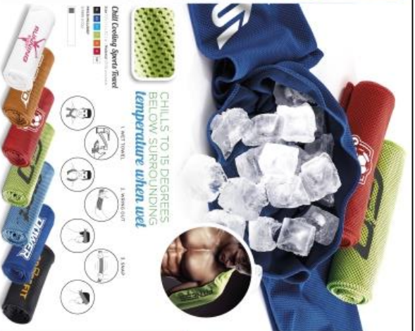
CHILLS TO 15 DEGREES BELOW SURROUNDING temperature when wet 1. WET TOWEL 2. WIND UP 3. SHAKE Call Cooling Sports Pack