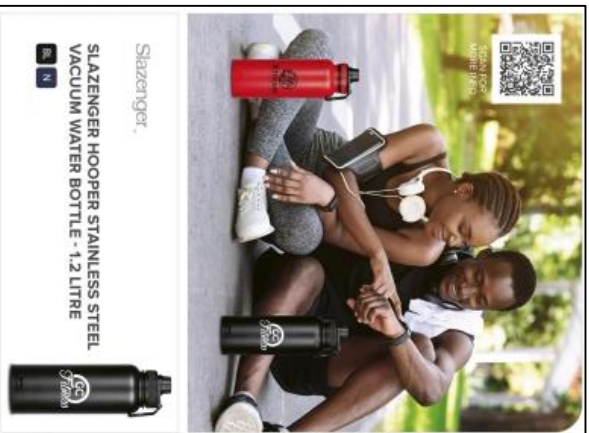
Slazenger SLAZENGER HOOPER STAINLESS STEEL VACUUM WATER BOTTLE - 1.2 LITRE