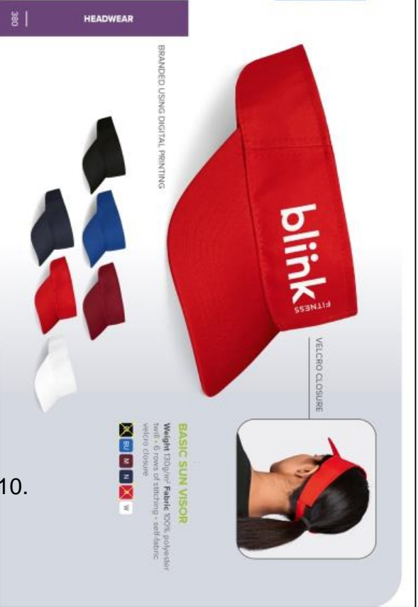
BRANDED USING DIGITAL PRINTING VELCRO CLOSURE BASIC SUN VISOR Weight 120g/m 2 Fabric 100% polyester with 6 rows of stitching - self fabric velcro closure